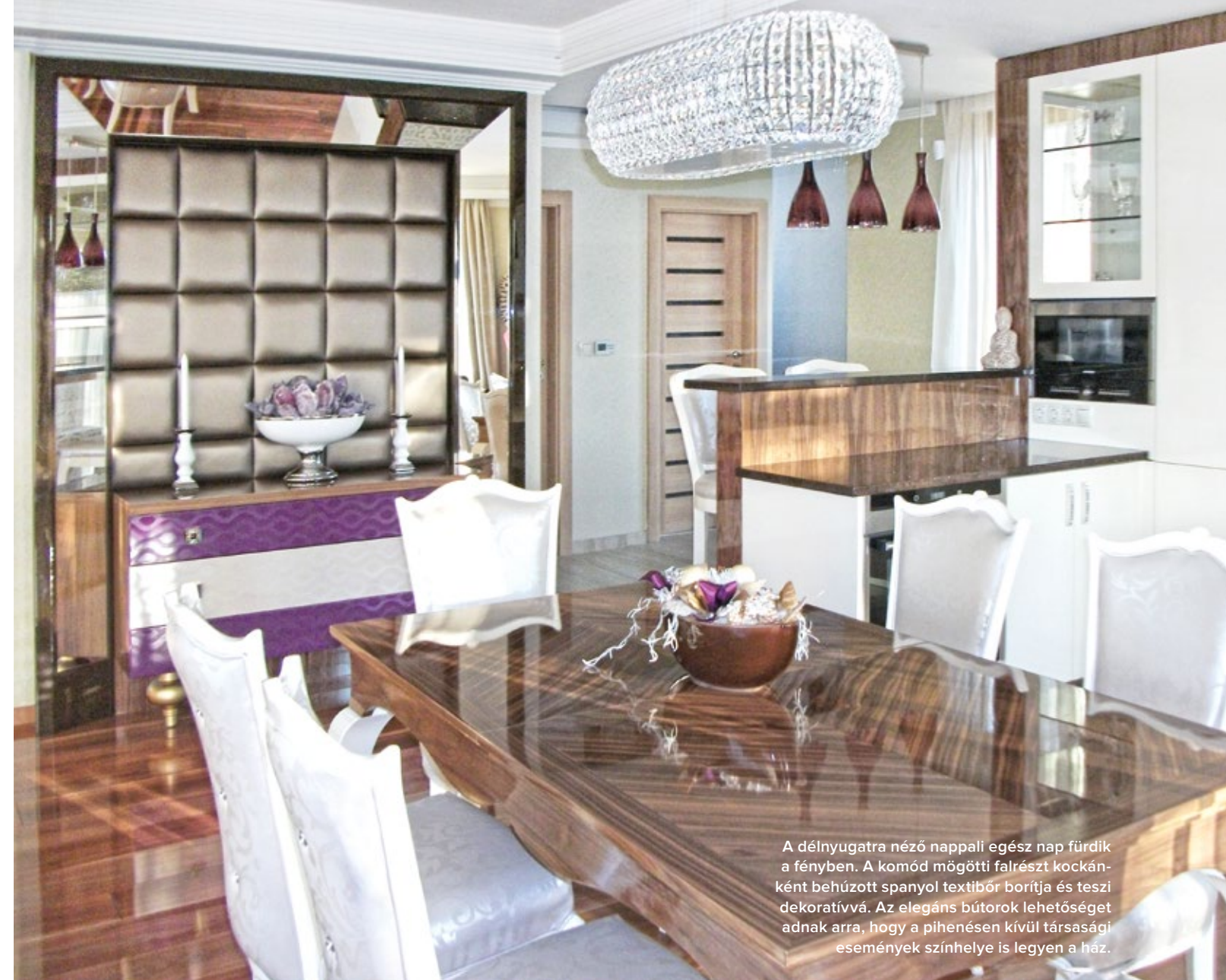
A délnyugatra néző nappali egész nap fürdik a fényben. A komód mögötti falrészét kockánként behúzott spanyol textibőr borítja és teszi dekoratívvá. Az elegáns bútorok lehetőségét adnak arra, hogy a pihenésen kívül társasági események színhelye is legyen a ház.

A közvetlenül a vízparton álló házból gyönyörű a kilátás a magyar tengerre. A telek fekvése meghatározó volt az épület tájolásánál, ellentmondásban a passzívházak építési követelményével (mely elsősorban déli tájolást kíván), ennek ellenére – köszönhetően a bravúros tervezői megoldásoknak – rendkívül jó energetikai értékeket mutat.